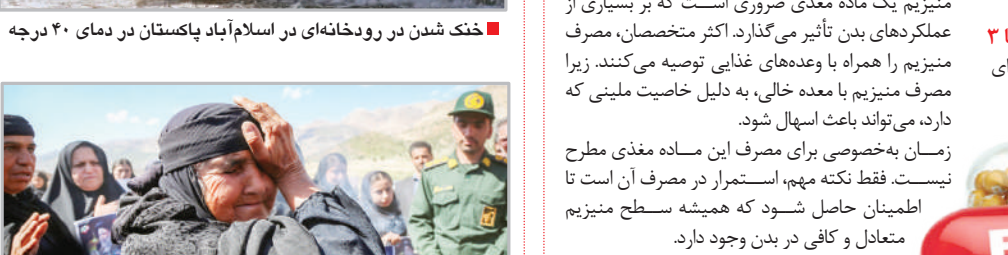
عزاداری بی بی گل در فراق رئیس‌جمهور شهید - کوهرنگ