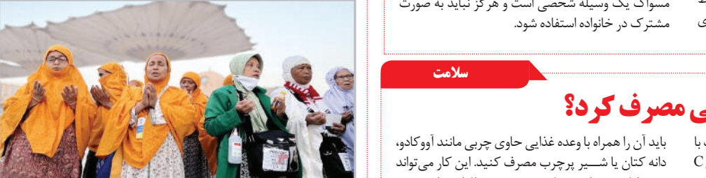
حال و هوای مسجداالتنبی در ایام حج ۱۴۰۳