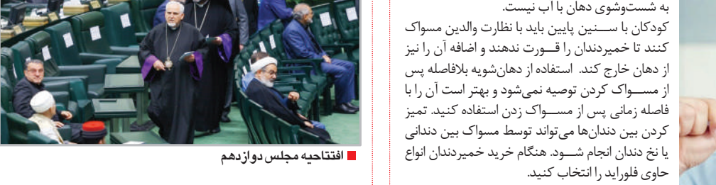
افتتاحیه مجلس دوازدهم