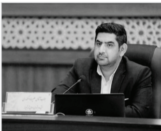
فرماندهی در محل

شهید به‌عنوان هویت اصلی جمهوری اسلامی ایران فراموش نشود و در کنار این مهم باید این نکته را به خودمان گوشزد کنیم که در راه خدمتگزاری به مردم و انقلاب با تاسی گرفتن از این شهیدان و سایر شهیدان والا مقام اقدامات ماندگار برای گذاشته و در راستای ترویج فرهنگ ایثار و شهادت گام برداریم. این عضو شورای اسلامی شهر شیراز تصریح کرد: شهرداری شیراز یکی از نهادهایی است که ظرفیت تحقق شعار سال یعنی جهش تولید با مشارکت مردم را دارد، شعاری که به مانند سال اخیر با توجه به وضعیت خاص کشور حول محور اقتصاد است که با آینده‌نگری مقام معظم رهبری سرلوحه کار کشور قرار گرفته و با کارگزاران نظام مقدس جمهوری اسلامی بدان توجه داشته باشند می‌توان بر موانع موجود فائق آمد.