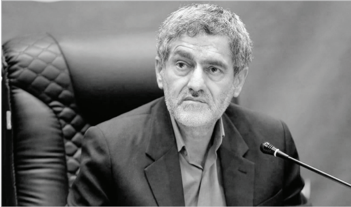
فرماندهی در محل

بهره‌وری وارد شوند؛ چراکه ورود منطقی در این زمینه چالش‌های فراوانی را کاهش می‌دهد. اصلاح لوله‌های انتقال آب شرب باید جدی گرفته شود نماینده عالی دولت در فارس بهره‌وری را نامحدود دانست و از ضرورت انجام آن در همه حوزه‌ها سخن گفت و تصریح کرد: به‌عنوان