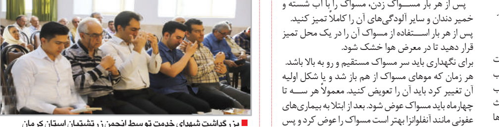
بزرگداشت شهدای خدمت توسط انجمن زرتشتیان استان کرمان