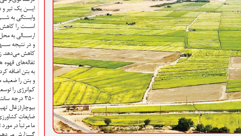
مزارع کشاورزی - مردودشت

این یک تیز و دو نشان است، چرا که نه تنها باستگی به شن و ماسه که یک منبع تجدیدناپذیر است را کاهش می‌دهد، بلکه میزان ضایعات آلی ارسالی به محل‌های دفن زباله را نیز کاهش می‌دهد و در نتیجه سهم آن در انتشار گازهای گلخانه‌ای را کاهش می‌دهد. زباله‌های آلی را که در این مورد همان تفاله‌های قهوه هستند، نمی‌توان به صورت مستقیم به بتن اضافه کرد، زیرا در طول زمان تجزیه می‌شود و بتن را ضعیف می‌کند. بنابراین محققان یک فرآیند کم‌آب‌تری را توسعه دادند که در آن تفاله قهوه در دمای ۲۵۰ درجه سانتیگراد بدون اکسیژن برای ایجاد یک بیوجار (غال تهیه شده از زیست‌توده‌های گیاهی و ضایعات کشاورزی) گرم می‌شود. ما مرتباً در مورد تحولات بالقوه و تغییرات صنعت مواد گسترش می‌دهیم، اما معمولاً نمی‌بینیم که از آنها به