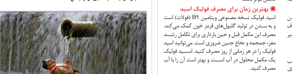
خفک شدن در رودخانه‌ای در اسلام‌آباد پاکستان در دمای ۴۰ درجه